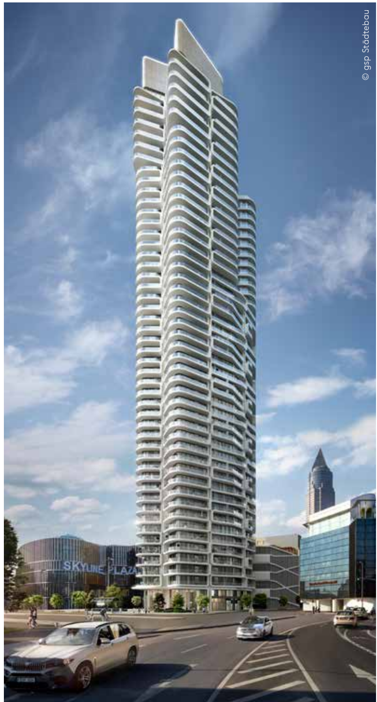
Abb.: Grand Tower, Frankfurt am Main, Referenzobjekt für eine Rauchabzugslösung

Vom Prototypen bis hin zur Serienfertigung des vollständig geprüften und zugelassenen Produktes bieten wir Ihnen alle Dienstleistungen an.